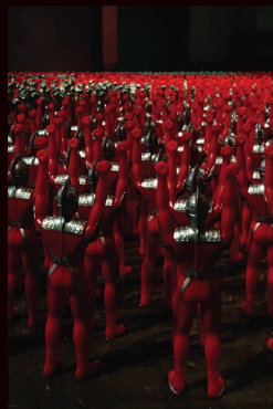
「バンザイ・コーナー」1991 柳幸典