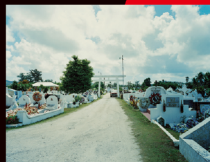
「無題（鳥居）」 下道基行