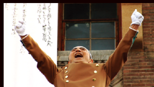
「なにものかへのレクイエム - Mishima」 森村泰昌