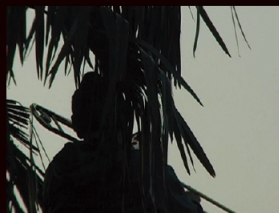
「決められないゴール」 アローラ&カルサディエラ